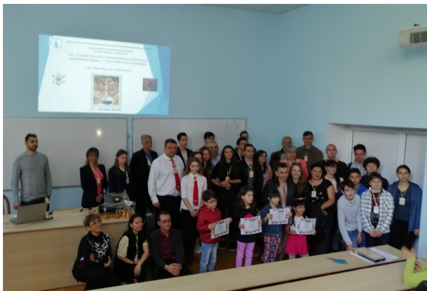
Наградените деца заедно с участници в конференцията.